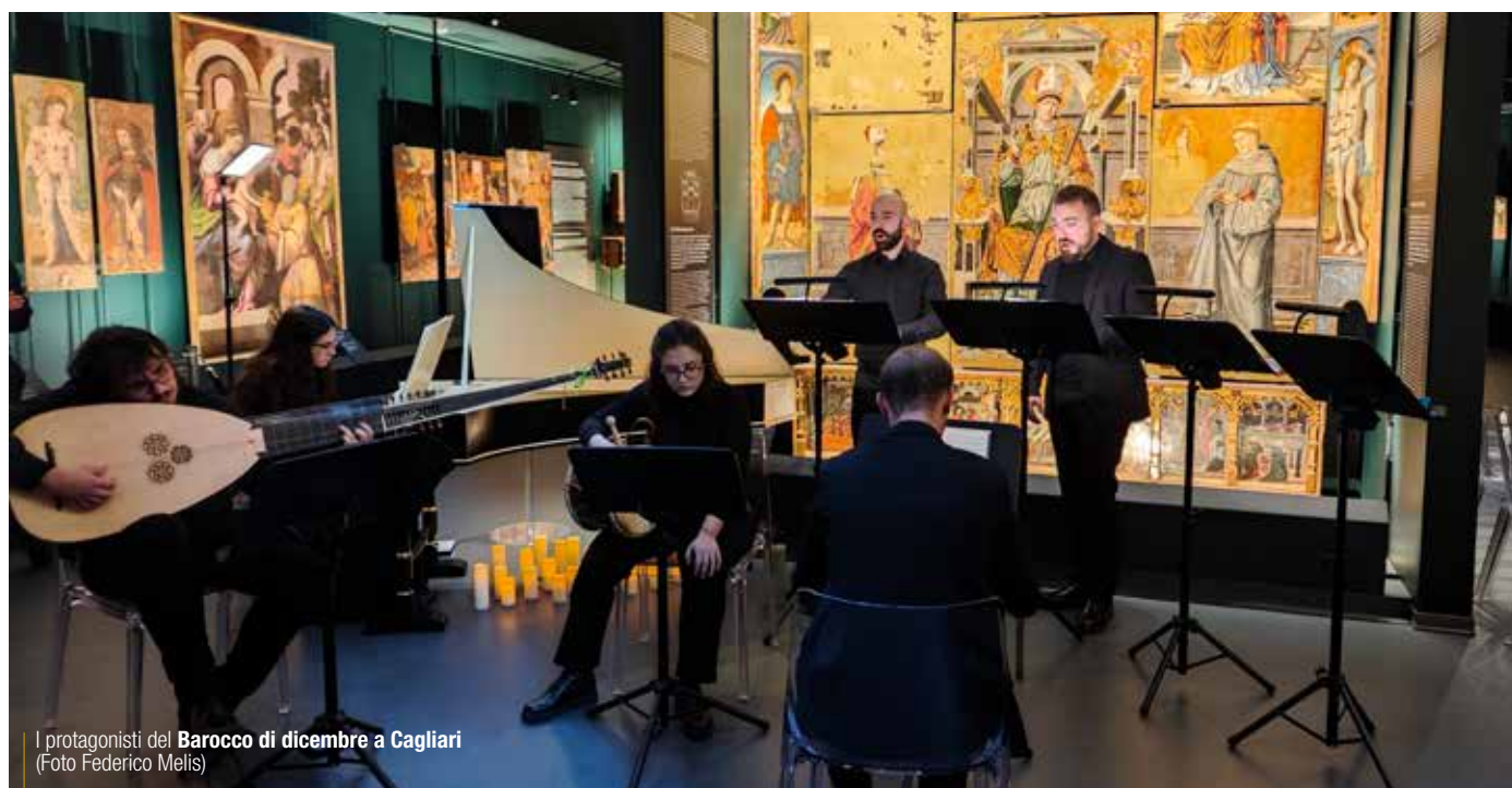
I protagonisti del Barocco di dicembre a Cagliari